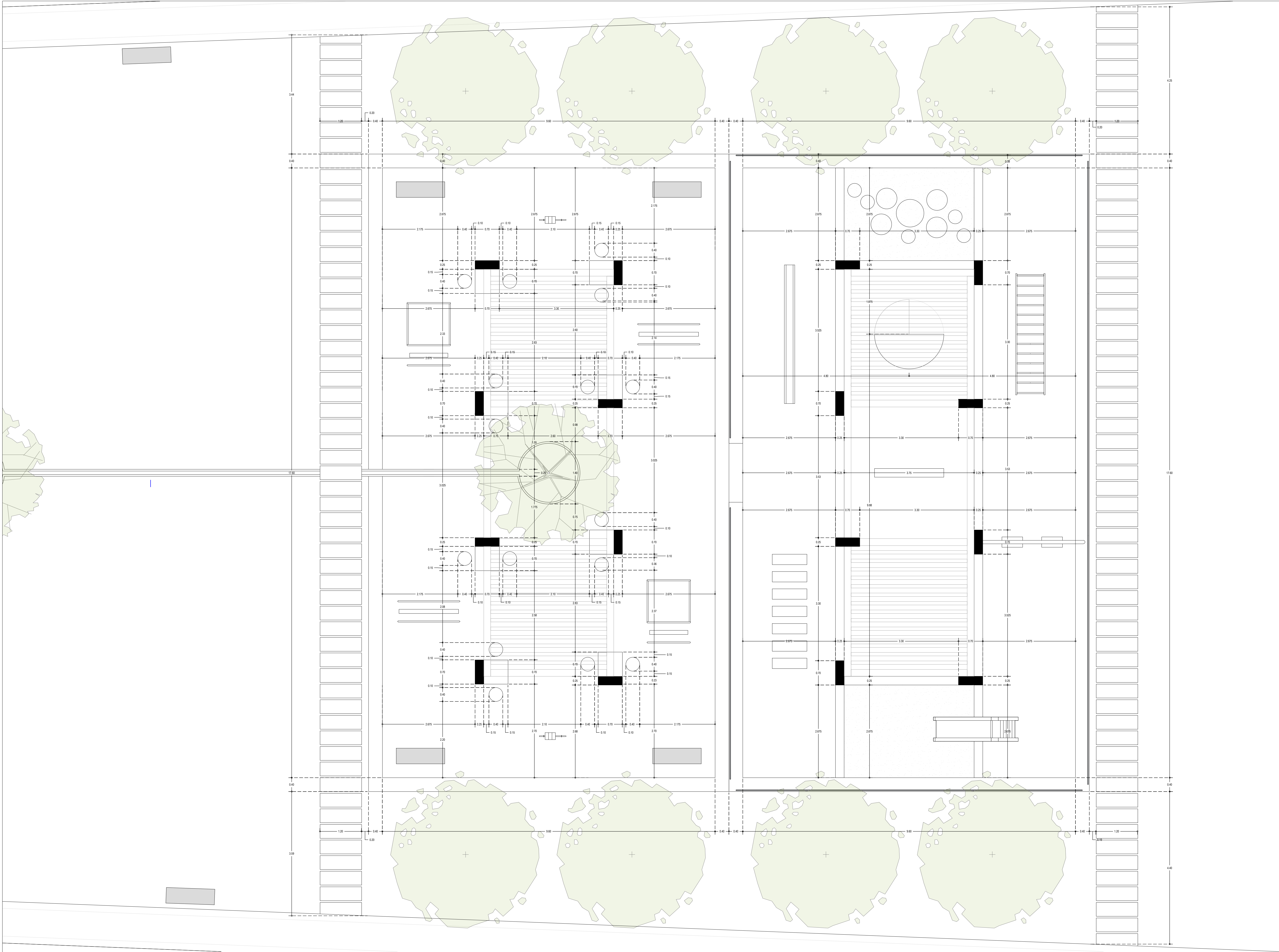
01 PLANTA ARQUITECTONICA SECCION 03 ESC. 1:75